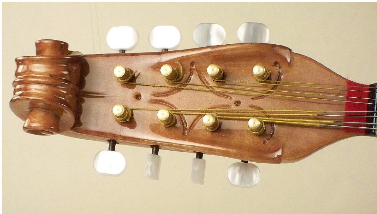
Paletta Romana (su richiesta)