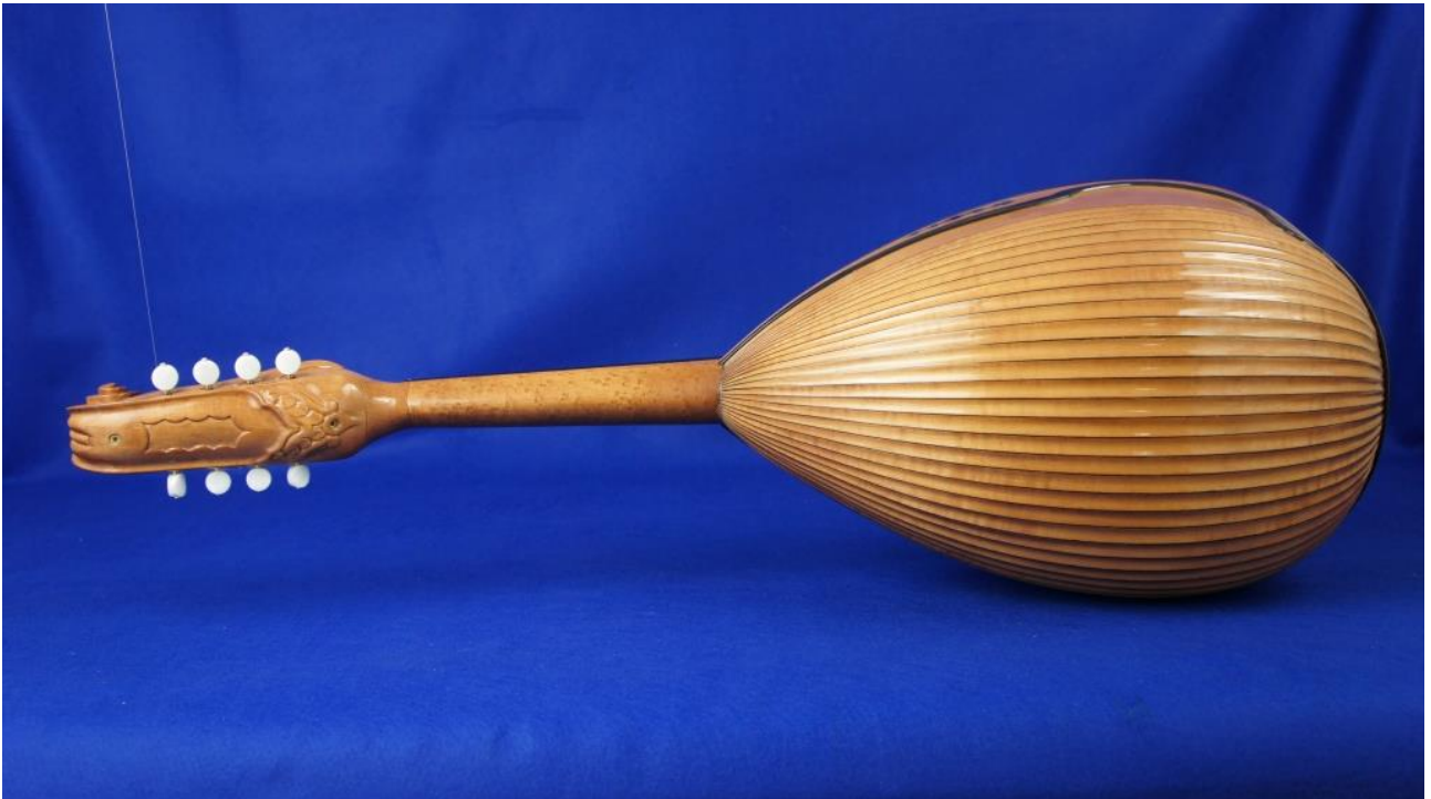
Particolare dello scudo