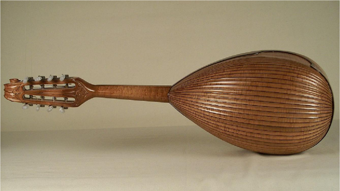
Particolare dello scudo